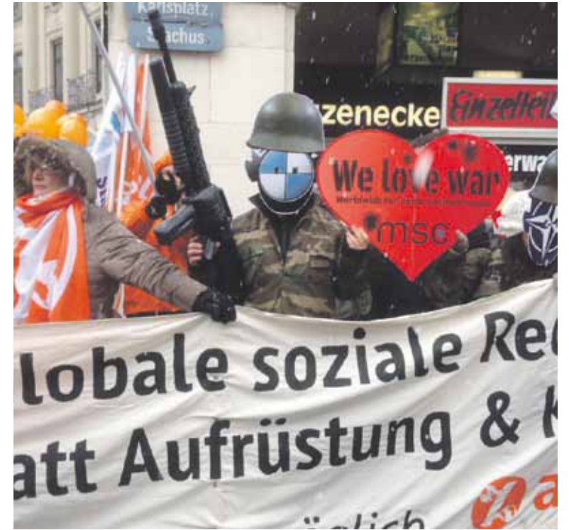
Anti-SiKo Proteste