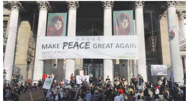
Make peace great again © Lucas Wirl