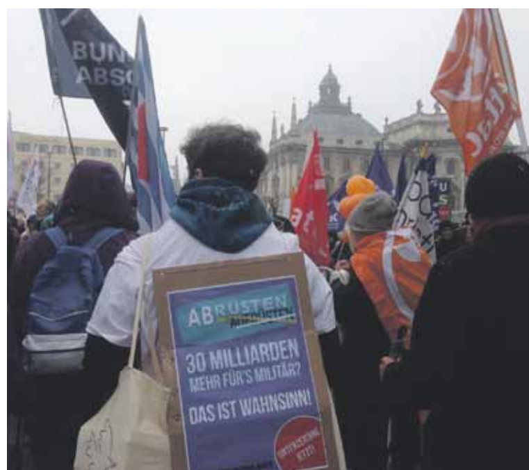
Anti-SiKo Proteste

Abrüstung statt Aufrüstung! Frieden schaffen ohne Waffen!