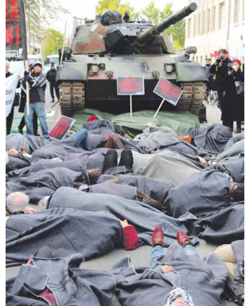
Proteste gegen Rheinmetall Rüstungsexporte

► Und schließlich geht es um Aufrüstung. Statt jetzt aber Friedensmissionen, Freiwillige oder Mediationsexpertinnen zu entsenden, drängen US-Präsident Trump und sein Außenminister Rex Tillerson darauf, dass die NATO-Mitgliedstaaten ihre Militärausgaben auf zwei Prozent des Bruttoinlandsproduktes erhöhen. Der Anteil der Verteidigungsausgaben am Bruttoinlandsprodukt (BIP) liegt in Deutschland bei 1,2 Prozent, das sind 37 Milliarden Euro. Erwartet werden demnach mehr als 70 Milliarden! Wollen wir das?